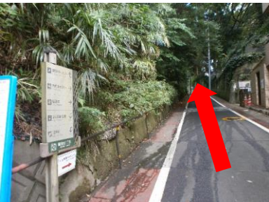
⑦歩道橋の階段横の上り坂に案内板があります。