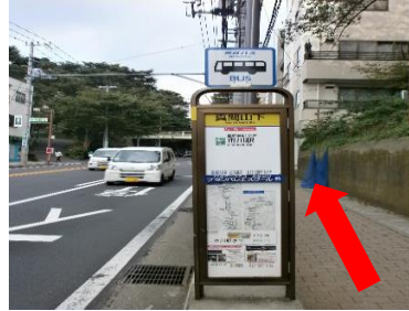
⑤途中『市川駅』行きのバス停があります。