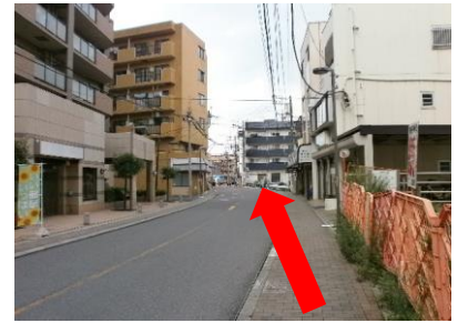
③橋を渡り直進します。