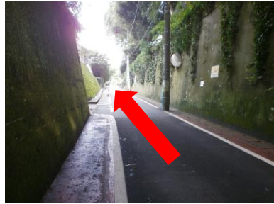
⑧坂をまっすぐの上ります。