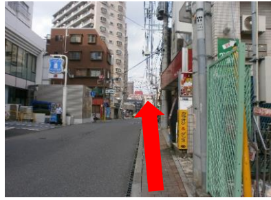
②まっすぐ進みます。