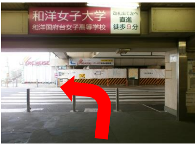
①改札を出ましたら横断歩道を渡り、左折します。