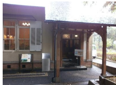
⑪「木内ギャラリー」の玄関です。