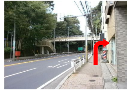
⑥歩道橋の手前で右折し、坂を上ります。