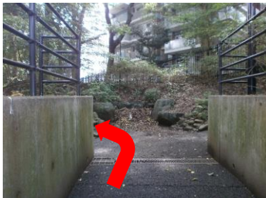
⑩通路へ入ったら左折します。