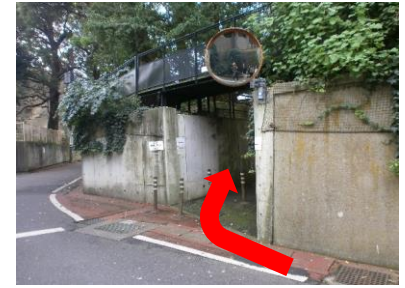
⑨右手に「木内ギャラリー」の入口があります。